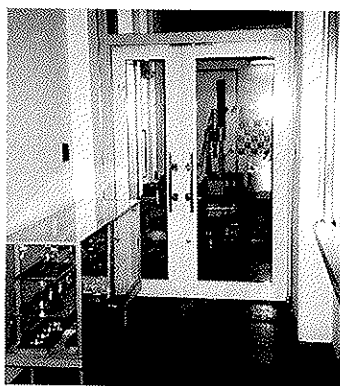
↑ 本社入口 製品陳列棚

遠藤社長の経営理念のもと、本社工場には16名、 栃木工場には4名のメンバーが24時間態勢を整え、